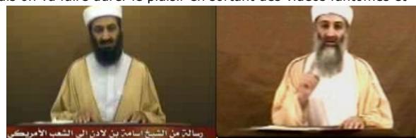
Plus jeune... 2007 ou plus vieux ? 2004